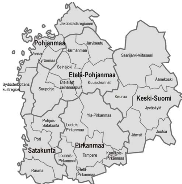
Kartta 1. Länsi-Suomen ohjelma-alueen maakunnat ja seutukunnat ohjelmakauden alussa

Euroopan aluekehitysrahastosta ja Euroopan sosiaalirahastosta osarahoitettavien toimenpiteiden ohjelma-alue koostuu Etelä-Pohjanmaan, Keski-Suomen, Pirkanmaan, Pohjanmaan ja Satakunnan maakunnista. Länsi-Suomen ohjelma-alueen viidessä maakunnassa on vuonna 2008 25 seutukuntaa ja 123 kuntaa. Toteutuneiden kuntaliitosten myötä vuoden 2009 alussa kuntien määrä on 105. Koko alueen pinta-ala on 65 000 neliökilometriä eli se on noin kaksi kertaa Belgian kokoinen.